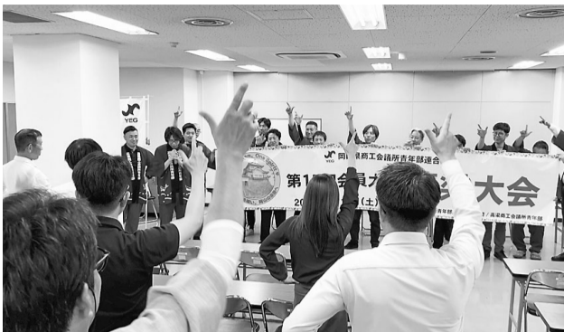
▲高梁商工会議所青年部によるPRキャラバン

例会では、高梁商工会議所青年部の皆様にご来訪いただき、本年度開催される岡山県商工会議所青年部連合会会員大会のPRが行わ