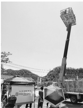
▲(株)ホークコクの高所作業車 試乗体験

企業ブランディング委員会では、今後も地域企業の魅力向上と情報発信に取り組み、市内企業と地域のさらなる発展につながる事業を展開してまいります。