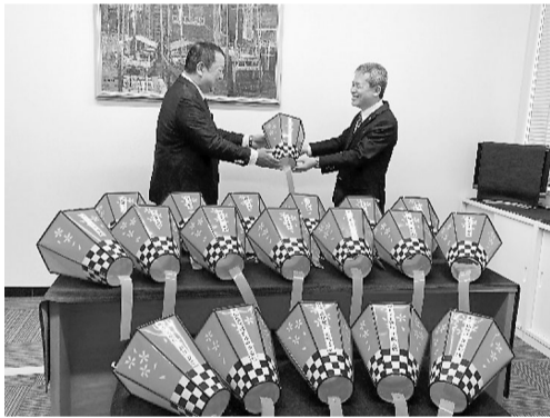
▲乗藤会頭から山崎副会長へボンポリ贈呈

寄贈したボンポリは、4月12日(日)まで毎日午後6時30分から10時まで点灯されます。小田川堤や相原公園などに設置され、幻想的で美しい光景をお楽しみいただけます。ぜひ足を運び、春の訪れを感じてみてください。